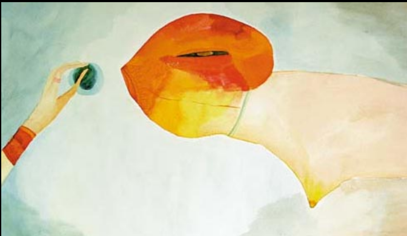
Kŕmenie, akvarel, 2000