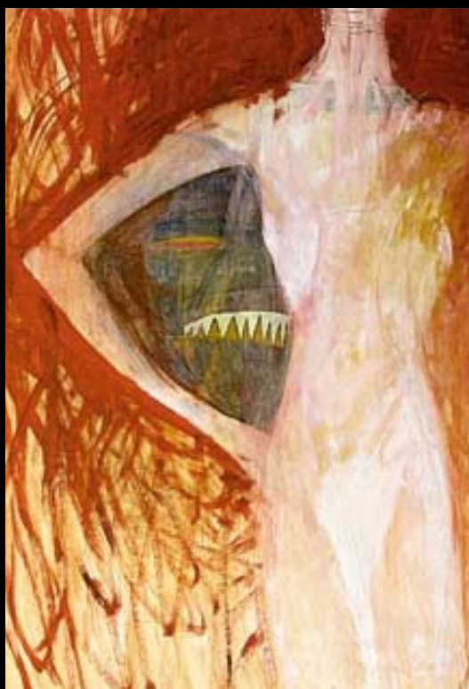
Salome, akvarel a tempera, 1999