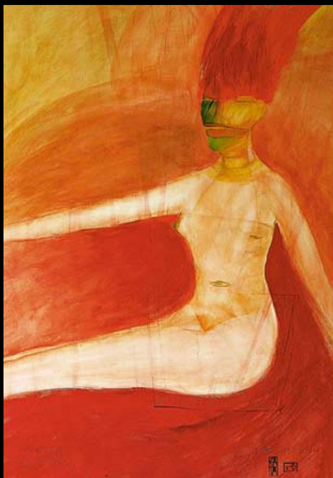
Swing - hojdačka, akvarel a tempera, 2002