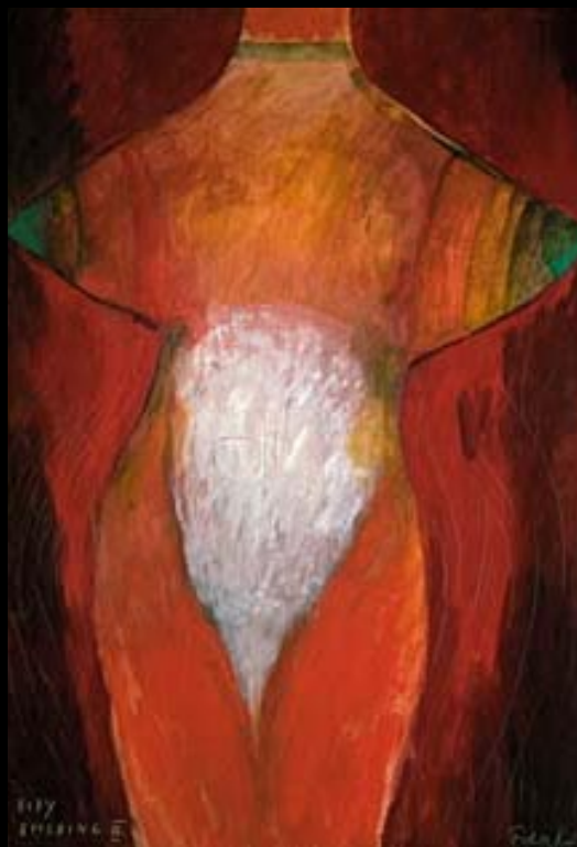
Body building, akvarel a tempera, 1998