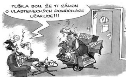
Kresba: Alan Lesyk. Pravda 6. 3. (Ale tie cudzie slová sex a eros musíš nahradiť slovenskými. Len aby neboli vulgárne.)