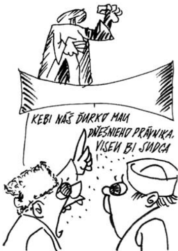
Kresba: Štefan Maday. Tele plus 3. 4.

(Najmä ak by to bol kritik pána Najvyššieho sudcu.)