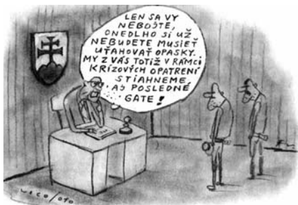
Kresba: Fedor Vico. HN 5. 3. (Tak vyzerajú najväčšie výdobytky sociálne solidarnej politiky.)