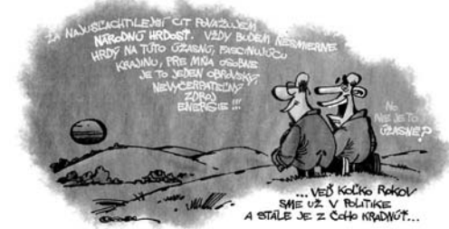
Kresba: Pavel Jakubec. HN 9. 3. (Máme za čo byť hrdí na svoju vlasť a jej robotný ľud.)