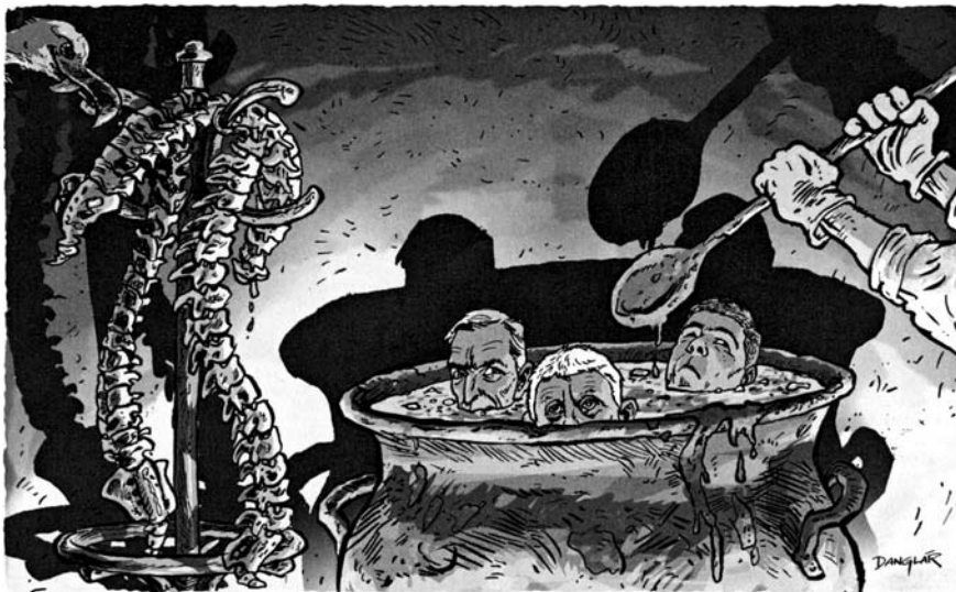
Kresba: Dan Glár. Trend 3. 11.

(Ak hľadáme schopnosti, ktoré približujú človeka k Bohu, nie sú to ani tak výkony kázateľov, ale častejšie geniálne diela architektov, skladateľov a výtvarníkov.)