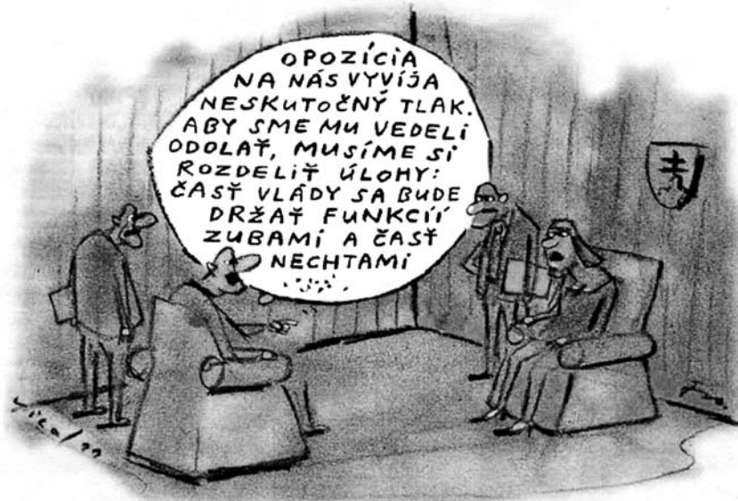
Kresba: Fedor Vico. HN 3. 10.

STV presunie vysielanie hlavných správ na 19. hodinu, teda na čas, keď začína vysielaf správy aj TV Markíza. Vedenie STV nepripúšťa možnosť, že nové správy sa medzi silnou konkurenciou nepresadia. Ak však tento zámer